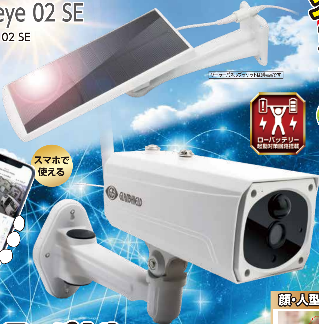
ソーラーパネルブラケットは別売品です